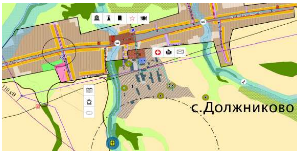
Схема границ прилегающих территорий муниципального казённого образовательного учреждения Должниковская начальная общеобразовательная школа