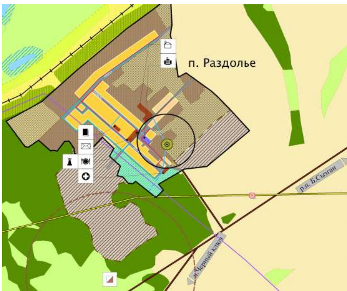
Схема границ прилегающих территорий медицинского учреждения ФАП п. Раздолье