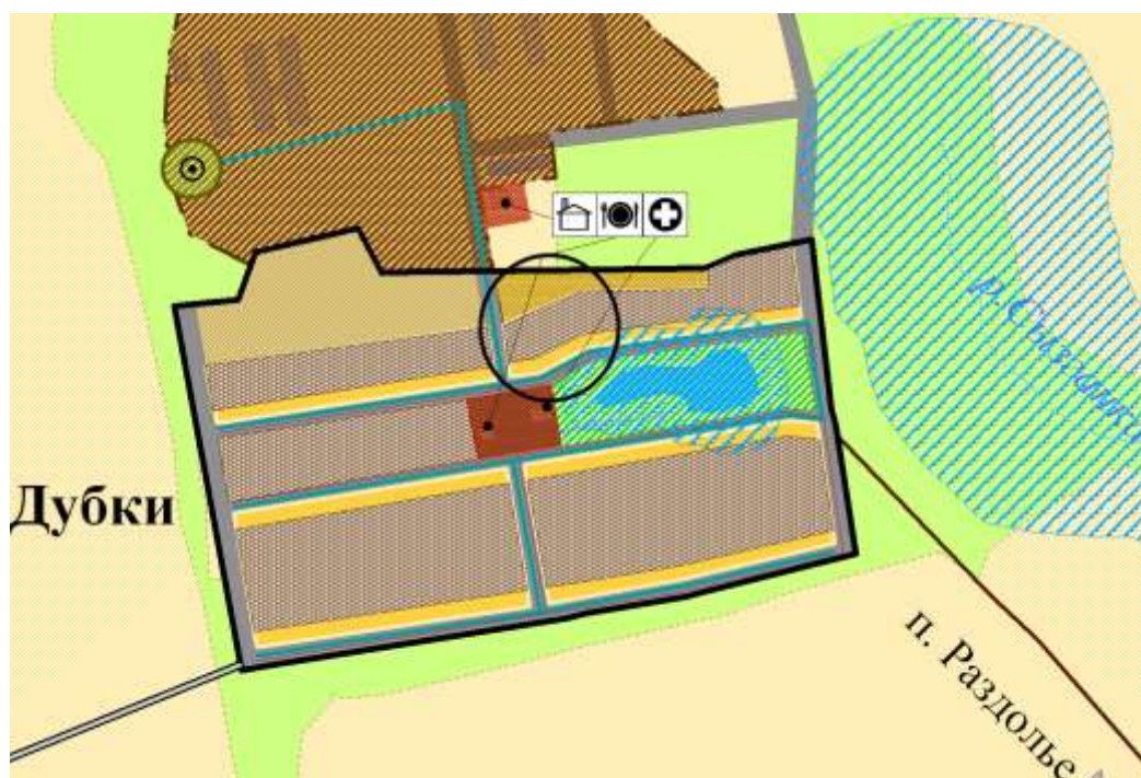
Схема границ прилегающих территорий медицинского учреждения ФАП п. Дубки